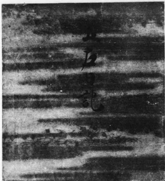
紙 表 本 原